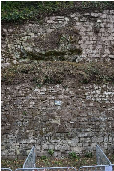
Déformation du parement inférieur surplombée par le talus intermédiaire et un affleurement rocheux saillant