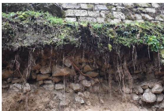
Maçonnerie de blocage mise à nue derrière l'arase du mur effondré