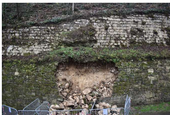
Vue générale de l'effondrement partiel du parement inférieur