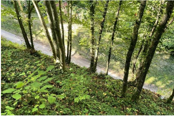
Développement des arbres du parc à l'aplomb du mur de soutènement