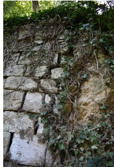
Épaulement du parement supérieur contre la roche à l'extrémité Sud ; fissuration et désolidarisation des pierres