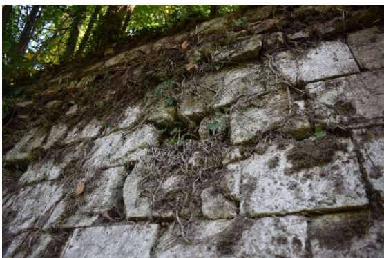
Lacune localisée de parement ; nombreuses racines se développant au travers du mur