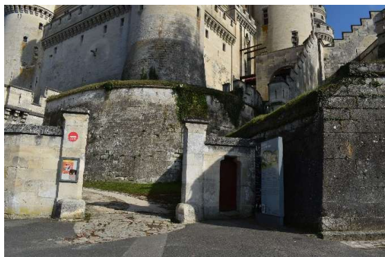
Portail d'accès principal du château face à la rue Napoléon