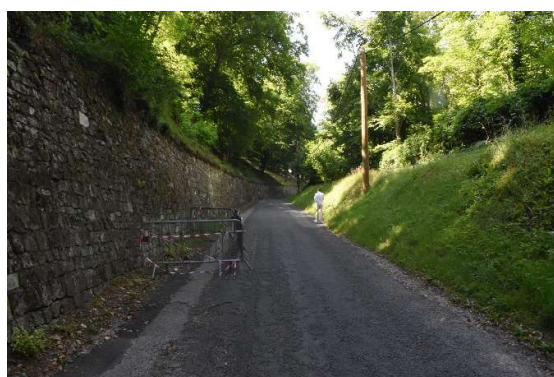
Rue Viollet-le-Duc encaissée entre le mur de clôture du château et un talus en vis-à-vis