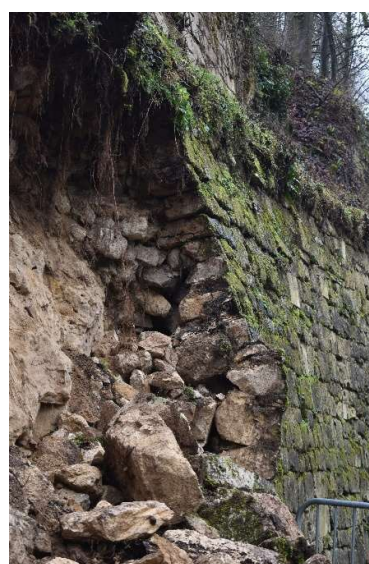
Déformation de parement de part et d'autre de l'effondrement