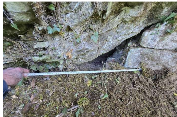
Refoulement des terres par les infiltrations au- dessous de l'affleurement rocheux favorisant les infiltrations derrière le parement inférieur