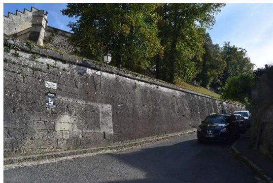
Extrémité Nord du mur de soutènement bordant la rue Viollet-le-Duc