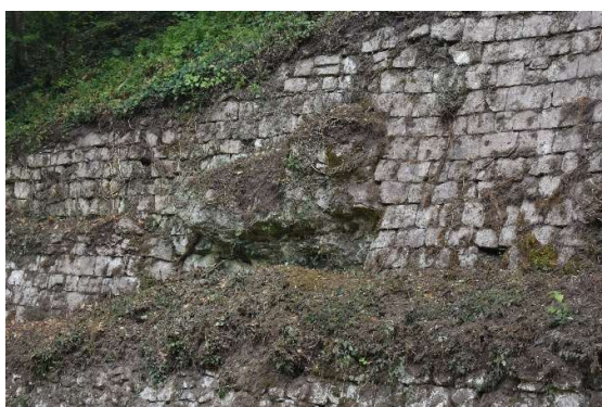
Affleurement rocheux saillant au droit du parement supérieur