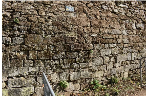
Déformation du parement inférieur : fissures et ouverture des joints causées par la poussée des eaux d'infiltrations à l'arrière du mur