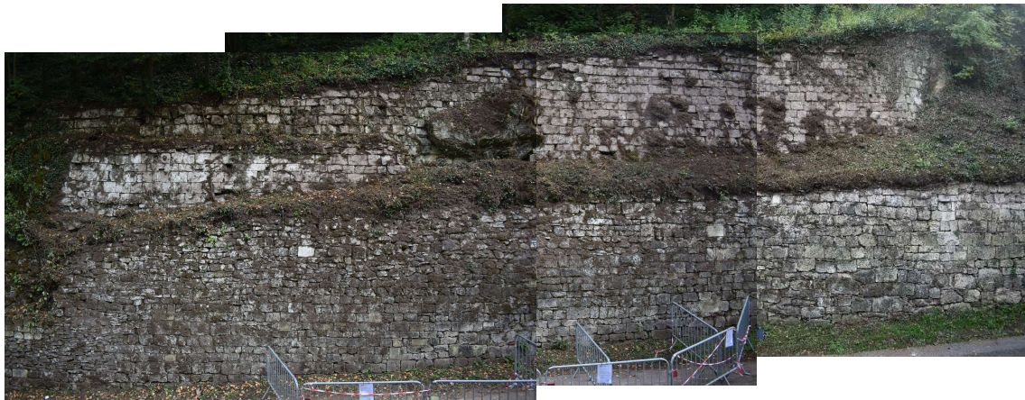
Élévation du mur de soutènement le long de la rue Viollet-le-Duc ; parements hauts et bas séparés par un talus intermédiaire