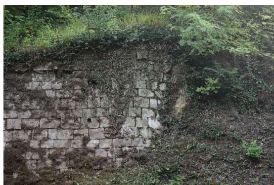
Parement supérieur adossé contre un éperon rocheux à l'extrémité Sud