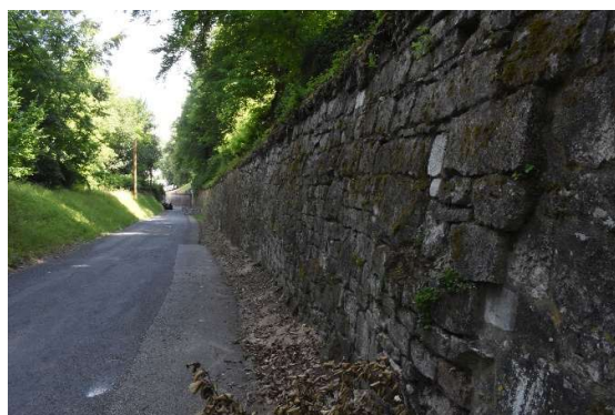
Base du mur et chaussée goudronnée séparées par un accotement en terre