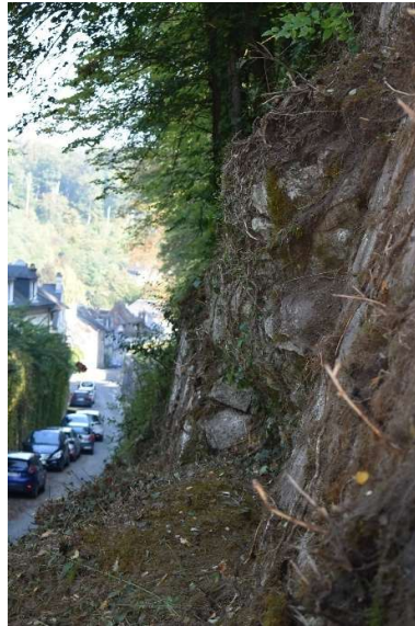
Affleurement rocheux du parement supérieur vu de côté : porte-à-faux important