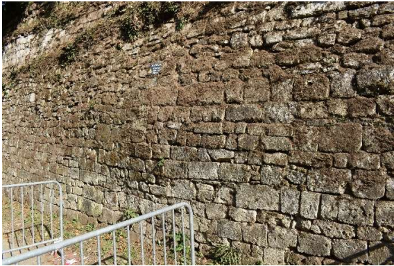
Déformation importante du parement inférieur : renflement des maçonneries sur 5 mètres linéaires ; formation d'un porte-à-faux