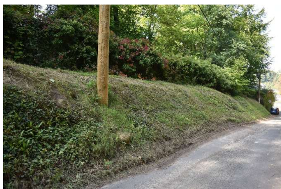
Talus enherbé bordant l'Ouest de la rue Viollet-le-Duc