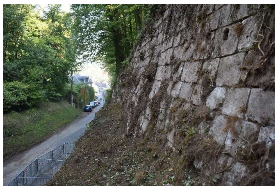
Talus intermédiaire entre les parements hauts et bas du mur ; fruit du parement haut pour reprendre la poussée des terres