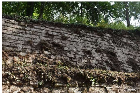
Parements colonisés par la végétation avec développements racinaires dans les joints