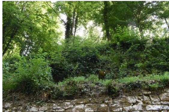
Parement supérieur masqué par la végétation avant débroussaillage