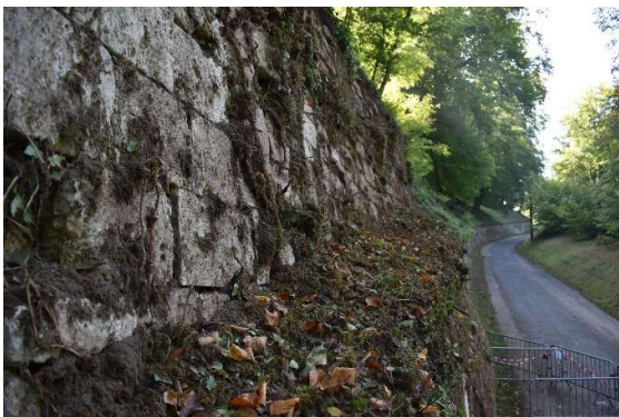
Arases couvertes de terres végétales et exposées aux infiltrations