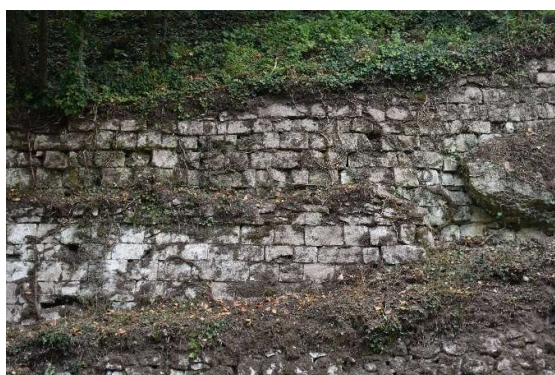
Parement supérieur décomposé en deux murets superposés au Nord de l'affleurement rocheux