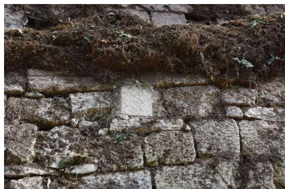
Reprise de parement au ciment avec une pierre neuve en contraste de teinte et de finition