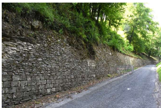
Mur de clôture avant débroussaillage (parement supérieur sous la végétation) P. BORTOLUSSI ACMH