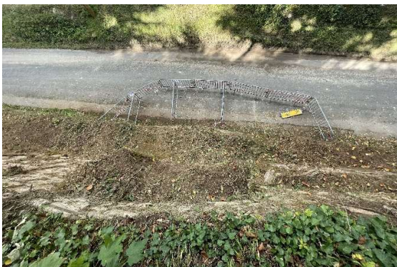
Talus en terre vus de dessus propices aux infiltrations et au développement de la végétation