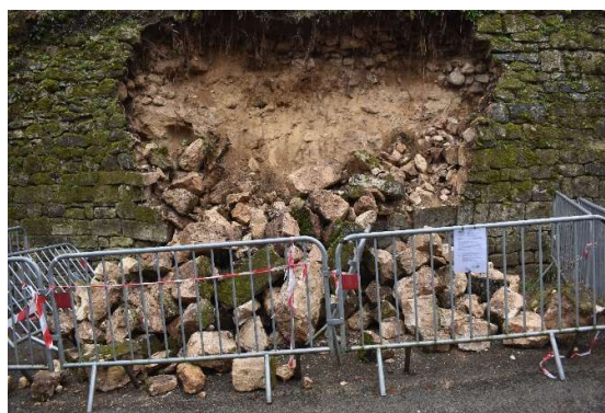
Gravats effondrés : pierres de parements, moellons de blocage, terres sablonneuses