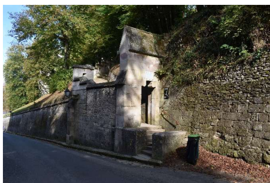
Poterne Saint-Jean et escalier à l'esplanade du château depuis la rue Viollet-le-Duc