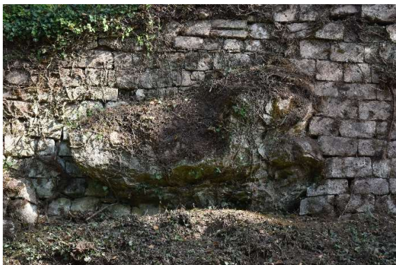
Fissures et affaissement des pierres du parement supérieur autour de l'affleurement rocheux